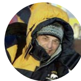
ФОТО И ТЕКСТ: РОМАН ДЕНИСОВ

В первые посетить Норвегию мне довелось в далеком теперь уже 1994 году, будучи командированным на научно-исследовательское судно «Академик Курчатов» с подводными аппаратами «Мир» один и «Мир-2» на борту – им предстояло опуститься к затонувшей в Норвежском море атомной подводной лодке «Комсомолец». Наш корабль зашел тогда в расположенный за Полярным кругом порт Хамерфест, и впервые передо мной и моей фотокамерой открылись необыкновенной красоты норвежские пейзажи: холодная синева неба и уди-