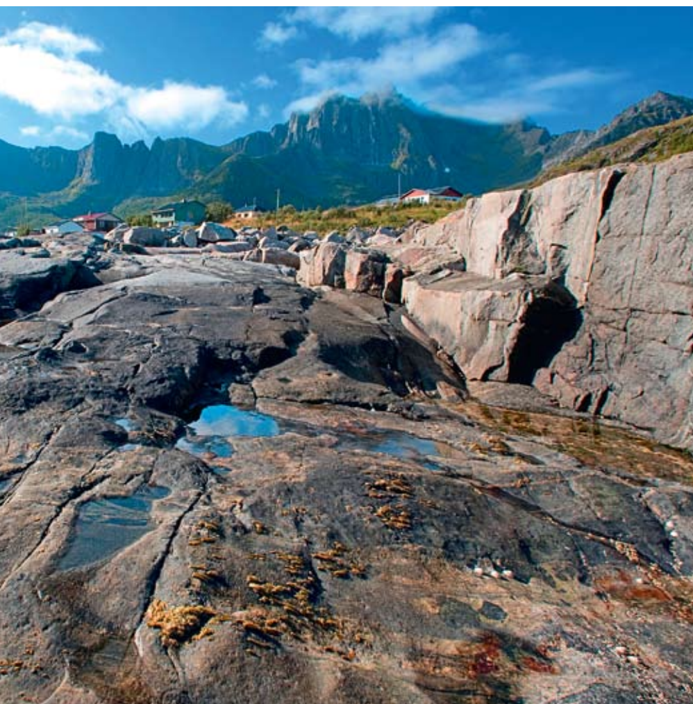
Царство камня и воды

К слову, световой день в Норвегии зависит от времени года. Из-за близости к Полярному кругу зимой здесь светает очень поздно, и рано наступает ночь. Летом – белые ночи, как в Питере. Ближе к осени день все еще достаточно длинный, что дает возможность насладиться съемкой в полной мере. Именно осенью мне однажды довелось снимать норвежскую рыбалку. Самым трудным поначалу было уловить появление рыбы на крючке из воды. Немало пришлось потратить дублей, прежде чем натренировался, набил руку. Выдержка не менее одной тысячной, объектив, словно ружейный ствол, направлен в одну точку, где едва заметная леска входит в воду, и... хоп! Захватывающее действие: словно пуля вылетает из воды рыба! И даже самый быстродействующий мотор камеры в этом случае не спасет, если не сработает пальцем на упреждение. Съемка рыбалки сродни фоторепортажу с теннисного корта: если не поймал мяч на теннисной ракетке, кадр не удался. То же и здесь: рыба на крючке, вылетающая из воды – неперемное условие удачного кадра.