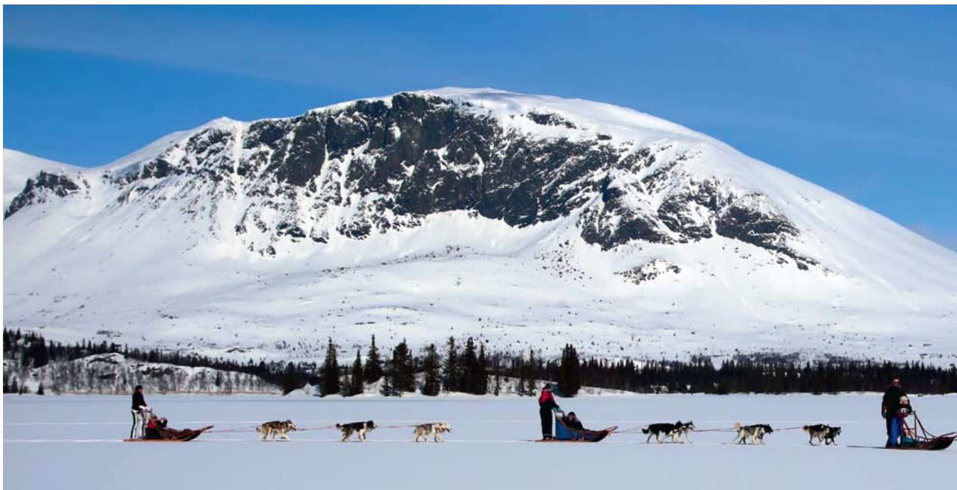
Вперед, на север!