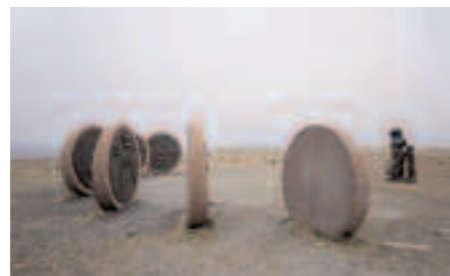
Le cap Nord, à 71° 10' 21 nord, sur l'île de Magerøya.