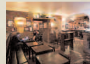
Le pub de la brasserie Mack, à Tromsø.