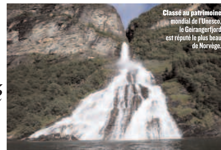
Classé au patrimoine mondial de l'Unesco, le Geirangerfjord est réputé le plus beau de Norvège.

V eni, vidi, vici. « Je suis venu, j'ai vu, j'ai vaincu » : c'est probablement ce qu'a dû penser – non sans légitimité à l'époque – le prêtre italien Francesco Negri lorsqu'il parvint au cap Nord, en l'an 1664, deux ans après son départ de Ravenne. Une falaise abrupte culminant à 308 mètres, (toujours) battue par les vents, (souvent) cachée par les brumes, et située à 71° 10' 21" nord, sur l'île de Magerøya, département du Finnmark, Norvège. « La destination la plus septentrionale de l'Europe », martèlent les circulaires touristiques (1).