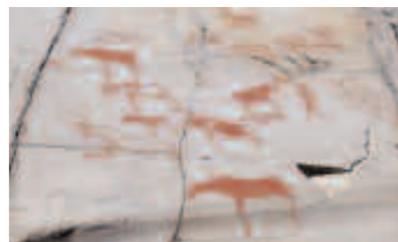
Les gravures rupestres d'Alta ont 6 000 ans.