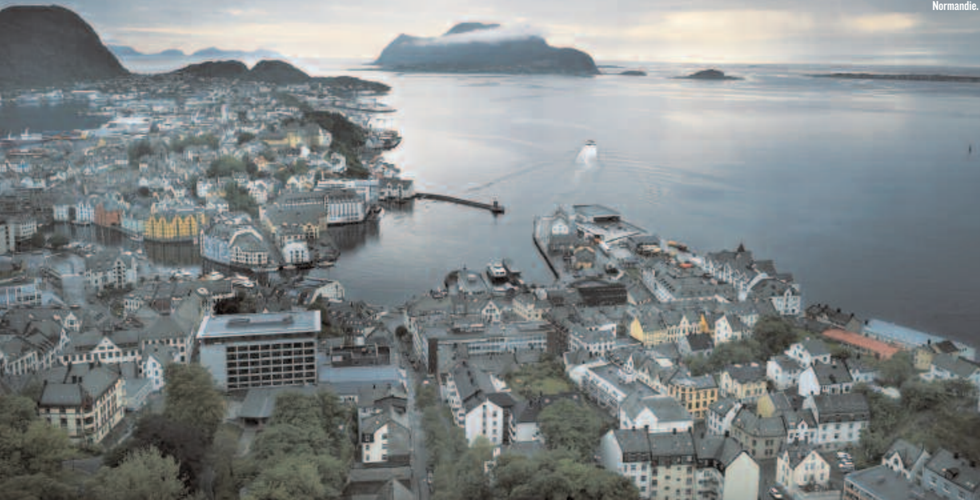
A Alesund, on trouve la statue de Rollon, renégat norvégien qui créa le duché de Normandie.