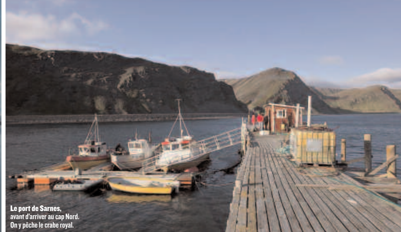
Le port de Sarnes, avant d'arriver au cap Nord. On y pêche le crabe royal.