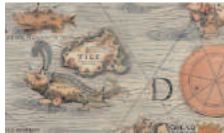
Cette carte de 1539 fait apparaître l'île de Thulé.

niprésente dans la geste norvégienne. Il faut aller à Tromsø (69° nord) pour s'en rendre compte (6). Une ville de 60 000 habitants, surnommée le « Paris du Nord » pour son ambiance fêtarde et où tout, vous dira-t-on par autodérision, y est labellisé « le plus septentrional d'Europe » : le téléphérique, la cathédrale, la brasserie (et sa bière Mack), le Burger King,