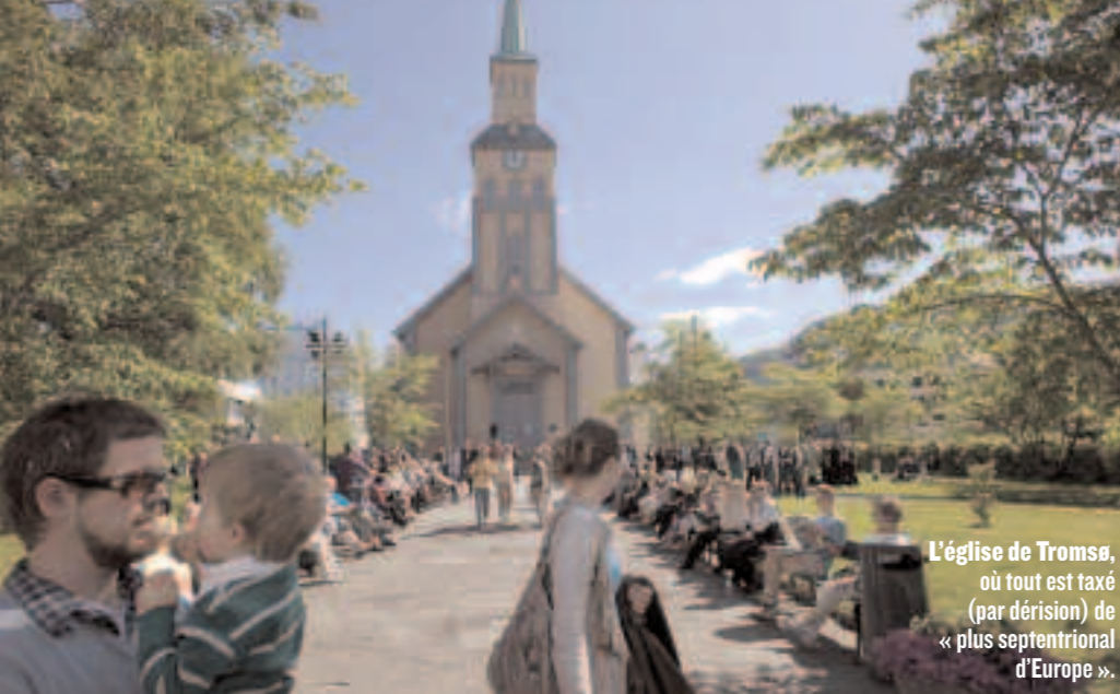
L'église de Tromsø, où tout est taxé (par dérision) de « plus septentrional d'Europe ».